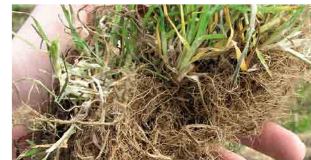
... и метёлка обыкновенная