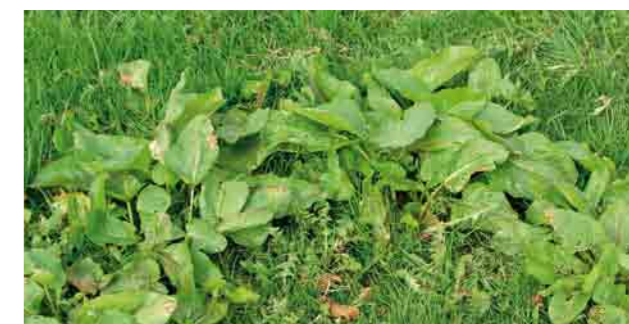
Проблематичный: щавель ...

При постоянном практическом применении происходит увеличение урожайности на 10 – 15 %. Ваши затраты на такие технологические операции, как покос, вспушивание, валкование, уборка, сматывание всегда одинаковые. Вот только урожайность разная! Чего же Вы ещё ждёте? Мы с радостью поможем Вам советом.