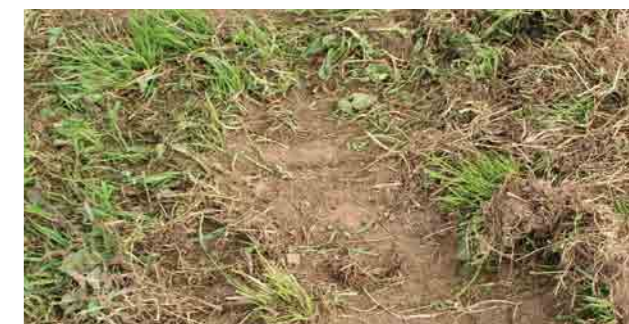
Проплешины в насаждениях после засухи.