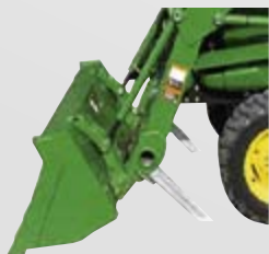
Atbalsta statīva komplekts