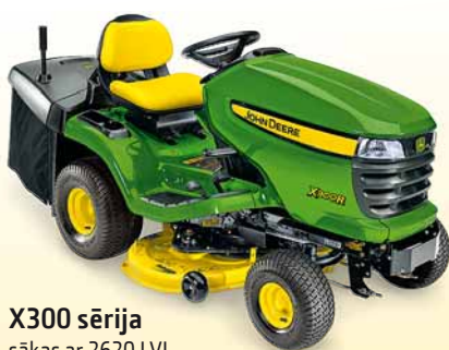
X300 sērija sākas ar 2620 LVL

Izsmalcinātās sērijas traktori ir saražoti labāk, lai kalpotu ilgāk.