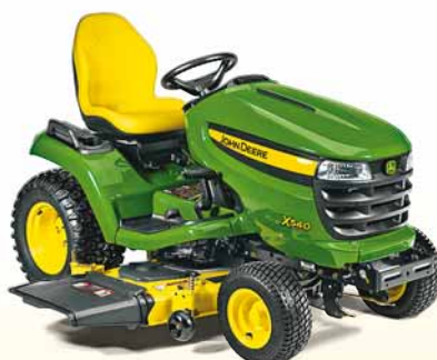
X500 sērija sākas ar 5080 LVL