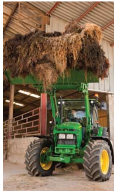
Tęsinys 2 puslapyje.

• Ieškantiems pigesnio sprendimo – 16/16 Sync Reverser. Naudojant sankabą perjungiamos visos pavaros, o darbo kryptis keičiama naudojant galios reverso rankenėlę, esančią šalia vairo. Visos pavaros sinchronizuotos, todėl perjungiant ir keičiant važiavimo greitį nereikia sustoti.