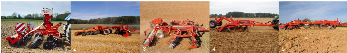
1. OPTIMER+ 2. DISCOVER 3. DISCOLANDER 4. CULTIMER L 5. PERFORMER

Daugiau informacijos apie artimiausią KUHN atstovybę rasite mūsų interneto tinklalapyje adresu www.kuhn.com