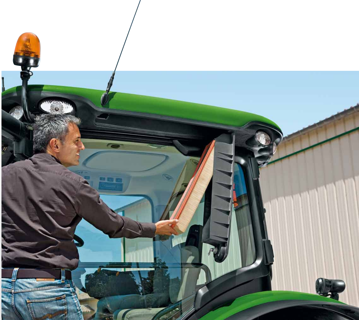
Pakeisti kabinos oro filtrą visiškai lengva!